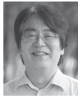
京都大学名誉教授 広井 良典