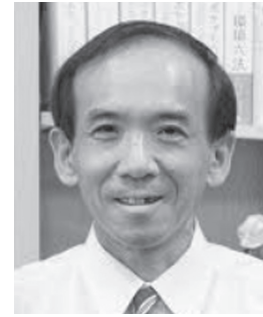
千葉大学 大学院 社会科学研究院 教授 水島 治郎